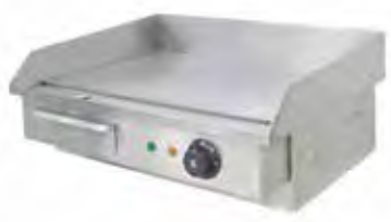
OPEG 818 / Plancha con placa de acero tratado 8mm.

Dos opciones para adaptarnos a sus necesidades, ver medidas. Cajón recoge grasas, fácil limpieza Con cajón de recogida.