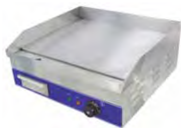
OPEG 500 / Plancha con placa de acero tratado 8mm.